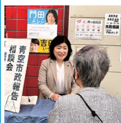
3/23の市政報告会の様子