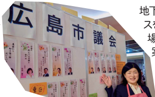
地下街シャレオで行われた「食品ロスを減らそう!スマイル!ひろしま広場」広島市議会は先輩議員の発案で各議員の食ロス川柳を展示しました。(10/27)