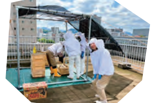
「中一区187号線活性化委員会」の皆さんが平和大通りの近辺で行われている養蜂プロジェクト。世羅高校の先生、生徒さんも関わられ2年目になりました。(6/3)