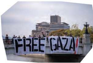
パレスチナで続く非人道的状況。ガザ虐殺開始半年に抗議するイベントに参加。巨大バナーに「FREE GAZA」の文字。原爆ドームを訪れた様々な方にメッセージを書いてもらい元安橋に掲げました。(4/7)