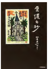
「原爆句抄」松尾あつゆき著 (書肆侃侃房)