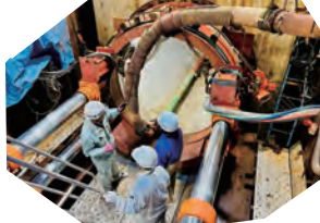
千田地区浸水対策(雨水幹線の整備)は上職地区でたびたび発生している浸水の問題にも対応するものです。(4/25)