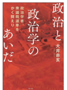
「政治と政治学のあいだ」大井赤亥 著 (青土社)

人口減少と少子高齢化という現実にあって、町内会、学校、病院、鉄道などをいかに維持するか...民主主義はますます「利益分配」から「コスト分配」の時代へと入って行っており、合意形成が難しい。しかし、これからの政治にとって避けて通れない課題という指摘に深く頷きました。