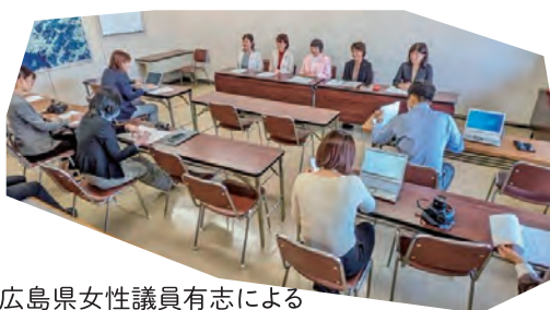
広島県女性議員有志による 声明発出記者会見(10月31日)

原爆ドーム付近では若者を中心に毎晩、LEDキャンドルを持ち寄り、即時停戦を訴えています。原爆ドームに来られる様々な国の方たちも「広島から声をあげてくれてありがとう」と賛意を示し、平和を願うメッセージを寄せています。私も時間の許す限り参加しています。