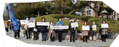
ガザ即時停戦を求めるサイレントアピール (12/23)