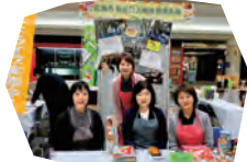
「スマイル!ひろしま広場」食品ロス周知イベント (10/29)