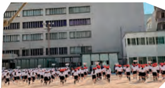
袋町小学校体育祭 (10/28)